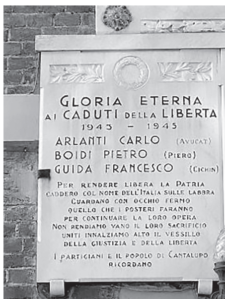
Cantalupo, sede della SOMS - ricordo dei partigiani caduti