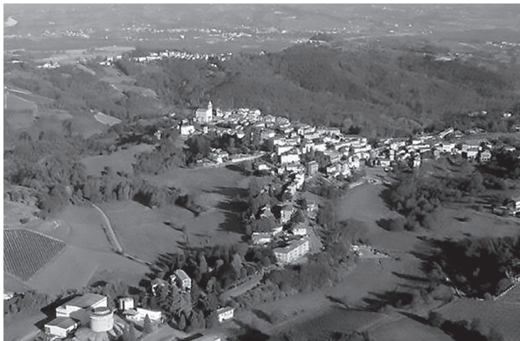
Le colline di Montaldo verso la piana alessandrina

Per l'ampliarsi del movimento, tra l'estate e l'autunno '44, il rischio di rastrellamenti diviene perciò sempre più alto, mentre si pone la questione dell'armamento di nuclei numerosi, come pure quello della tattica da impiegare: la presenza di ufficiali al vertice delle formazioni GL e la stessa influenza del conte Thellung di Ponzone