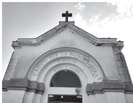
Cantalupo - 10 maggio 1945 - funerali dei partigiani - cappella del cimitero