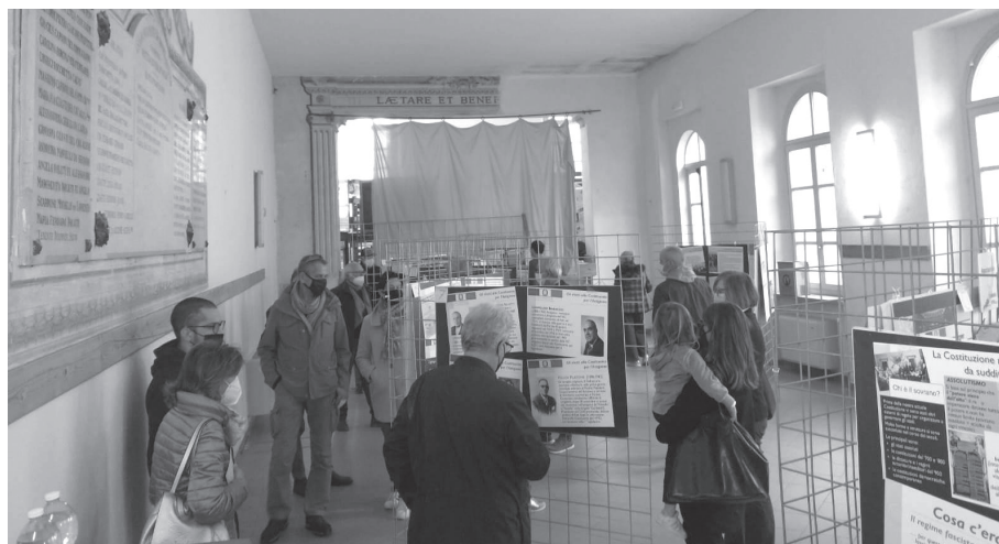
Mombaruzzo 17-24 ottobre 2021 - Mostra didattica "dalla Resistenza alla Costituzione"

rende concreto, locale, personalizzato, il richiamo a valori e disvalori, collega a luoghi e persone del territorio le riflessioni e gli esempi da trarre dal passato.