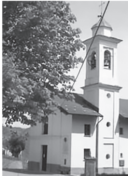
La chiesa di Bandita di Cassinelle con la lapide che ricorda i caduti del rastrellamento dell'ottobre '44

L'entusiasmo dell'estate, che aveva portato la GL a progettare perfino piani per l'insurrezione, è però destinato a spegnersi: nel giro di poche settimane, tra inizio settembre e la