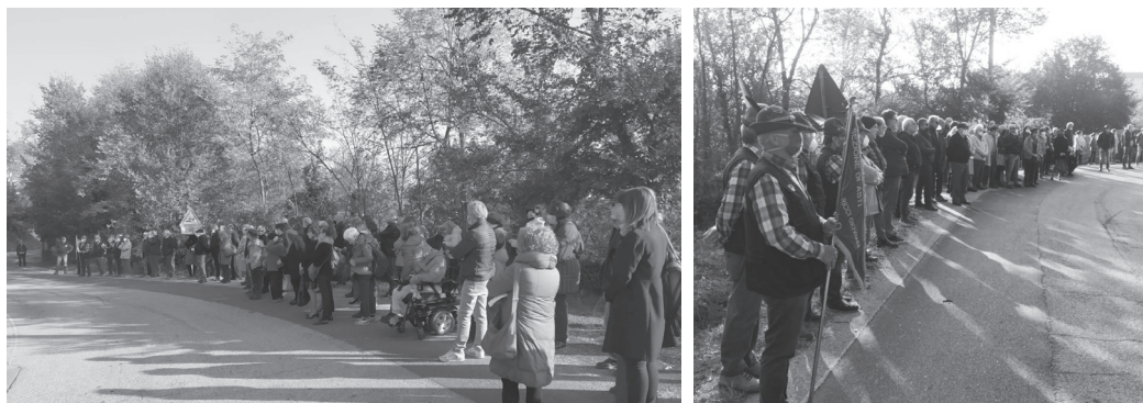
Mombaruzzo 17 ottobre 2021 - inaugurazione della lapide sul luogo dell'uccisione di Boidi