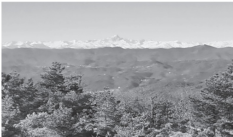
Le colline del Ponzonese dove si dislocarono diverse formazioni partigiane

formazione prescinde spesso da motivazioni ideologiche e politiche (a cui ben pochi erano avvezzi, visto il clima in cui erano cresciuti), sia perché le prime bande sovente non hanno ancora una chiara definizione/affiliazione ad una forza politica, sia perché giocano un ruolo determinante le persone che operano sul territorio vicino al luogo di origine di chi si arruola. Nel nostro caso, inoltre, va considerato che nell'area tra Alessandria e l'Acquese non è ancora organizzata una presenza partigiana di ispirazione cattolica, diversamente da quanto accade nel Casalese con la divisione "Patria", guidata Martino ( Malerba ). Non è quindi strano che un giovane cattolico si trovi in una banda giellina o garibaldina, specie se la sua adesione avviene nella prima fase della resistenza, come è appunto il caso del giovane di Cantalupo.