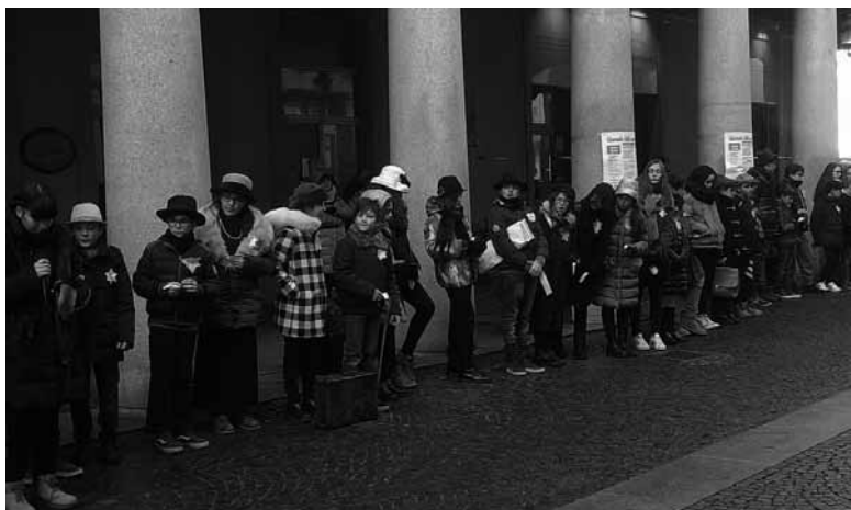
Acqui T. - Portici Saracco - GdM 2017 - gli studenti della scuola media interpretano i deportati acquesi

Direi che questo tipo di lettura sia stata abbastanza presente fin dall'inizio, sia nel caso di Acqui che in quello di Canelli, anche se nei primi anni 2000 le preoccupazioni erano forse meno forti rispetto a quelle di oggi. Un segno evidente di una impostazione sostanzialmente condivisa è stato l'aver privilegiato alcuni elementi, che affiorano da una ricognizione puntua-