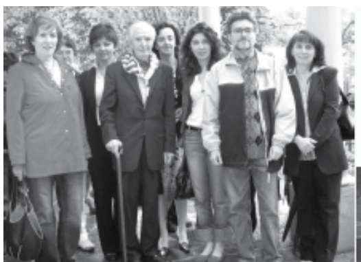
Canelli - Caffi - 2007 - il direttivo AMV incontra Ferruccio Maruffi, presidente dell'ANED (al centro col bastone)

una "vigilanza" nella sua gestione. Fin dall'inizio - e proprio da parte di chi è personalmente e culturalmente più vicino alla tragedia dei lager - si è evidenziato il rischio di 'addolcire' con iniziative consolatorie o di banalizzare la durezza di una tragedia che domanda una riflessione profonda. D'altra parte, molti hanno osservato che il rischio peggiore resta quello dell'oblio, della dimenticanza (interessata o meno) di un momento e di un progetto di sterminio che ha segnato un passaggio decisivo nella nostra storia. Una realtà che nessuno dovrebbe ignorare, proprio per il rischio reale che esso si possa ripresentare, magari in altra forma. L'ascolto dei testimoni ci mette in guardia da questa doppia preoccupazione (retorica e oblio) richiamandoci al fatto che questa memoria è "scomoda" o, per dirla con le parole di Primo Levi, è una "memoria a caro prezzo", per chiunque voglia avvicinarsi ad essa con rispetto o intenda trasmetterla con fedeltà e significato.