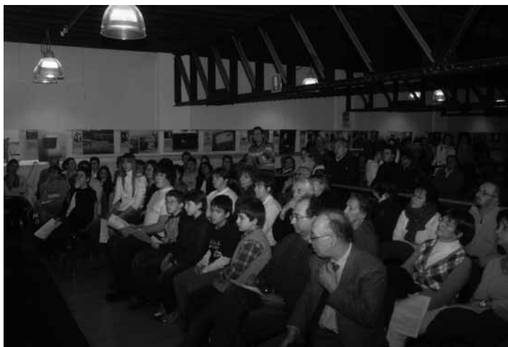
Acqui - Biblioteca Civica - GdM 2008: "In parole e musica" con letture degli studenti, musica ebraica, mostra sull'emigrazione ebraica piemontese in Israele

me e ai linguaggi della memoria utilizzati: la musica e il canto, il teatro e il cinema, la fotografia e il fumetto, la lettura di testi. Sia quelli espressi attraverso musicisti e attori professionisti, sia con gli interventi di giovani e ragazzi organizzati a livello scolastico o in compagini locali. Ancora riguardo ai linguaggi, di notevole interesse è stato l'utilizzo di mostre storico-didattiche dedicate a temi (il campo di Gries-Bolzano, la Shoah dei bambini, l'emigrazione ebraica in Israele) e personalità (Teresio Olivelli, Gino Bartali, Giovannino Guareschi).