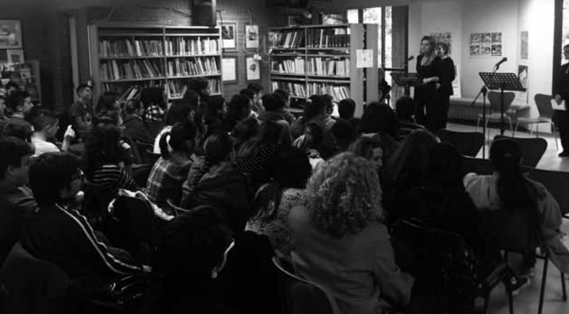
Canelli - Biblioteca Civica - GdM 2016 - incontro con gli studenti

Pulita, con Nuovo Cinema Canelli e con “Classico”, l’associazione nata nel 2015 che ha organizzato per quattro anni l’omonimo Festival della Lingua Italiana, dedicato al grande italianista G.B. Giuliani.