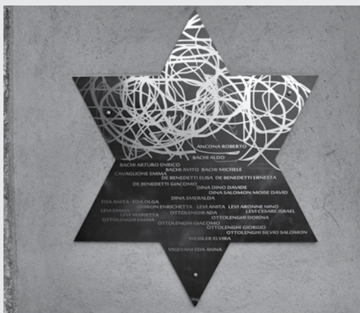
La stella dei deportati, collocata nel cimitero ebraico acquese a ricordo degli acquisi catturati e inviati nei lager