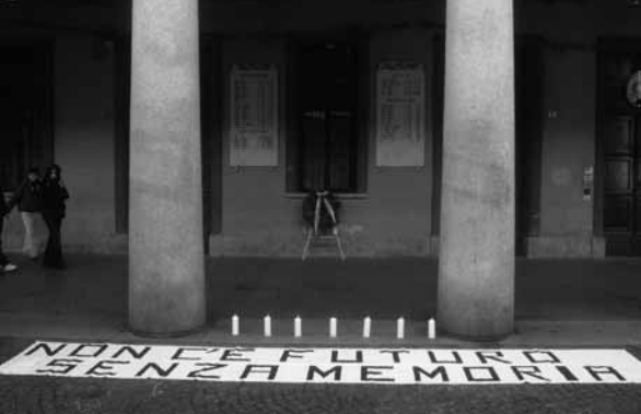
Acqui - Portici Saracco - davanti alle lapidi che ricordano i deportati acquesi